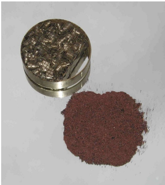
Foto 3: een hoeveelheid asrest (minerale, ijzerhoudend as) die als stof door de katalysatormodules uit de houtrook is gefilterd is na de verbranding van circa 20 kg luchtdroog beukenhout. Deze as zou anders als vliegas in de atmosfeer zijn uitgestoten.

Zowel fijnstof als vele verbindingen in de houtrook zijn potentieel schadelijk voor gezondheid en milieu. Geurcomponenten hoeven niet direct schadelijk te zijn maar kunnen wel aanleiding geven tot klachten betreffende stankoverlast. Houtrook die qua geur als bijzonder onaangenaam wordt ervaren kan een indicator zijn voor een slechte verbranding en voor de aanwezigheid van vele andere schadelijke verbindingen in de houtrook. Dat hoeft echter niet samen te gaan. Een nagenoeg volledige verbranding van houtsoorten van tropische herkomst kan een zeer sterke rookgeur opleveren. Omdat deze geur voor ons exotisch is wordt deze al snel als onaangenaam gekwalificeerd, terwijl er geen sprake hoeft te zijn van een schadelijke rook. Klachten betreffen veelal de stank van houtrook en de psychologische associatie met schadelijkheid. De uitstoot van fijnstof zal, voor zover deze niet als sterk gekleurde rook of als stank wordt waargenomen, daarentegen weinig aanleiding geven voor mensen om te klagen terwijl fijnstof wel degelijk een bedreiging vormt voor de volksgezondheid.