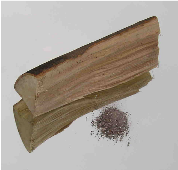
Foto: een rest van circa 5 gram minerale as blijft over na volledige verbranding van circa 500 gram luchtdroog beukenhout (20% vocht)

De verbindingen in houtrook die intensief kunnen geuren zijn uit de onderstaande groepen. Binnen deze groepen zijn circa 500 afzonderlijke verbindingen te onderscheiden.