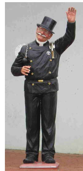
Foto 2: een beeld bij de ingang van de Schornsteinefegerschule in Dülmen

Een aantal van de hierboven genoemde verbindingen condenseren in de schoorsteen, tijdens het afkoelen, op vlieggas bestaande uit minerale bestanddelen en houtstof. Daarbij gaan vluchtige verbindingen dus over in de vaste stof; teer. Houtstof, minerale as, roet en teer vormen samen de fijnstof die uitgestoten wordt.